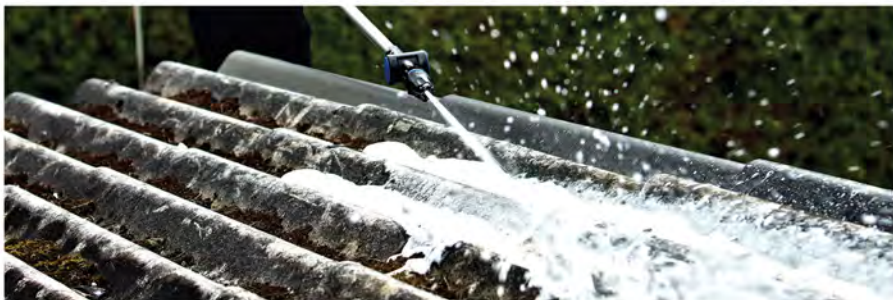
تمیز کننده سقف برای تمیزی سریع و آسان سقف. ترکیبی از راه حل های لوله تلسکوپی و مواد شوینده تمیز کننده