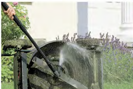
کیت چند برسه این برس را می توان بر اساس نیاز خود مجهز کرد. برای تمیز کردن وسایل نقلیه، چوبی، نرده ها یا رینگ خودرو

مبلان ویلایی ، دوچرخه ، نما، ورودی، پاسیو، تراس و بالکن همگی نیاز دارند هر از چند گاهی شستشو شوند. با لوازم جانبی مناسب برای واترجتتان می توانید هر آنچه را که بخواهید در اطراف خانه تان به آسانی و به بهترین شکل بشوید و بدون نیاز به موادی مثل وایتکس سطوحی مثل کاشی و موزاییک را مثل روز اول نو کنید. در اینجا با ابزارهایی که طراحی کردیم، در اینجا با ابزار های طراحی شده آشنا خواهید شد. لازم به ذکر است قطعا این تجهیزات در بهتر و راحت تر انجام شدن کارها موثر خواهند بود.