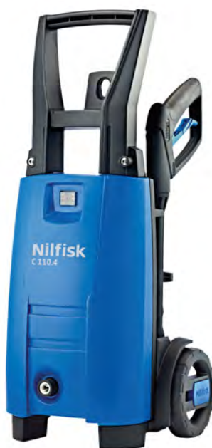
C 110.4-5 X-TRA