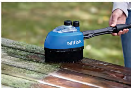
کیت چند برسه این برس را می توان بر اساس نیاز خود مجهز کرد. برای تمیز کردن وسایل نقلیه، چوبی، نرده ها یا رینگ خودرو