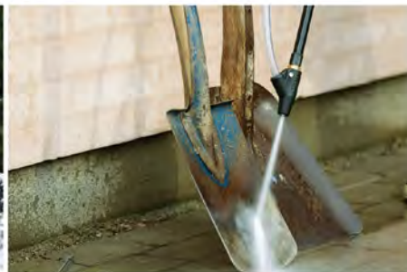
Water Sandblasting set برای کندن زنگ زدگی، رنگ و غیره از اجسام سخت