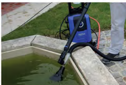
کیت مکش آب برای آسانی خالی کردن استخر، خشک شدن پاسیو، و یا مکان هایی که ورود آب خسارت بار است