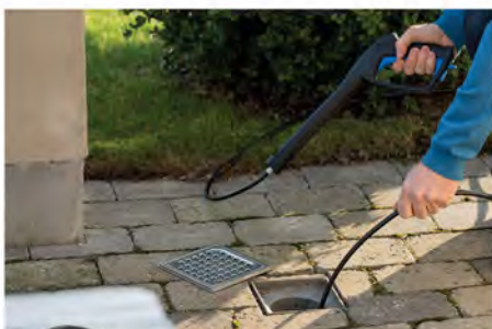
شلنگ ۱۵ متری لوله باز کن برای رفع انسداد و گرفتگی لوله ها و ناودان های باران ...