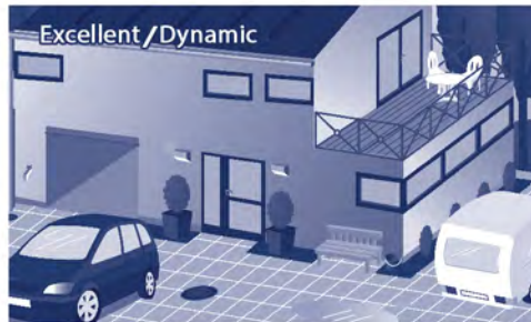
Excellent / Dynamic