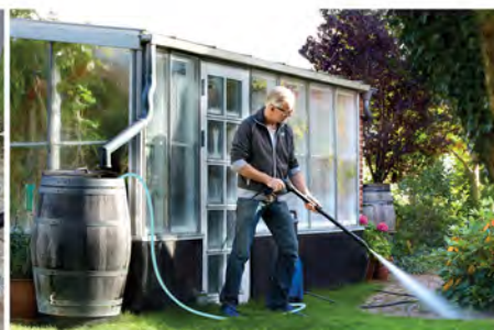
شلنگ استخراج کننده آب برای دوستی با طبیعت و استفاده از آب غیر لوله کشی. (در صورتی که آب منبع دارای ناخالصی باشد از فیلتر استفاده کنید.)