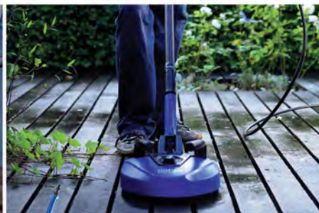
پاسیو پلاس راه حل بهینه برای نظافت پاسیو، راه رو، دیوارها، نرده ها و هر سطح وسیع دیگری