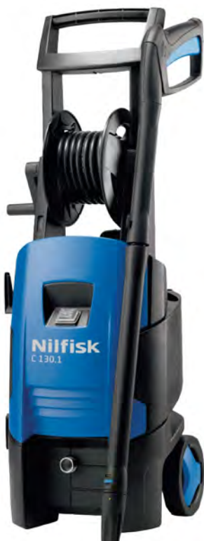
C 7-130.1-6 X-TRA

*** ایده آل برای شستشوی های معمول خانگی و یا وسیله ای برای تکمیل شوینده های حرفه ای